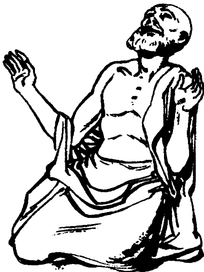
T'achivinini ju Dios

'Pus ju Dios lana k'ox k'ai chai lanach jantu lai machaxaniyau ju tuchi navi.