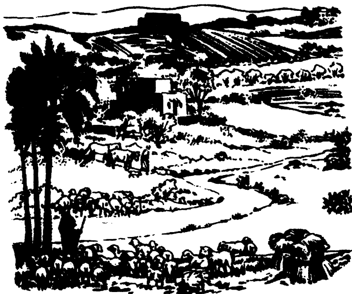
Ju Dios xtaknichokoi ju ix'alinta ju Job

ju quinchivinti ju xacnajun. Pus na astaninch icnajun ixlacata ju tuchi xacchivinin.