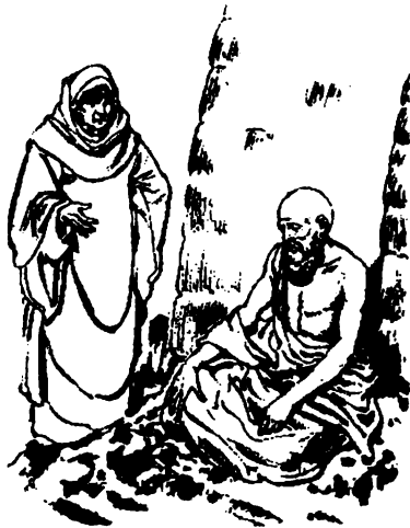
Chivinín ju ix'amachaka' ju Job

Pus chunchach ju putailhi'alhch ju Job ixlak'ayaca ju Dios. Chai lana jantu tu'u' naulh ju va amacxcai cava ixlacata ju Dios.