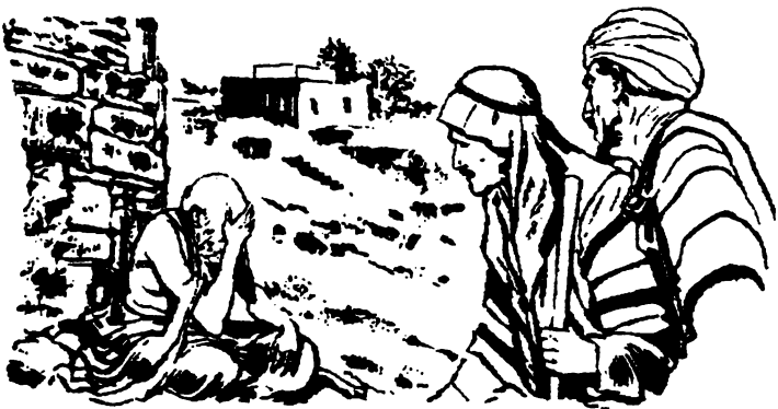
Tat'achivinin ju ix'amigojni ju Job

'Pus lana k'ox ict'achivimputun ju Dios ni laich aquinjunilh ni jantu icnavita tu'u' ju amacxcai. Pus na k'ox acghiula ni laich aquinjunilh ni vasalh icnavita tu'u' ju amacxcai. Pus ju quit'in lana va jantu icpast'ac'a tijuch ju lai acnavi ju va amacxcai cava. Pus lana jantu ijc'atsai tis ixlacatach ju ict'ajun lhimak'alhk'ajna'. Pus jantuch ijc'atsai tijuch ju lai acnavi.