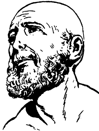
"Jantu k'ai icjunita," najunch ju Job.

--Pus ju tuchi na'un lana jantu tu'u' quinlhi'aklhtajui. Pus ijc'atsaich ni vasalh lana k'ox tachapun ju Dios. Para tach ju va jantuch qui'ulhtuni tach ju pulhijunch. Para jantu actinaulh ju va ta'eklhtamatch ni laich soknic'a catasu ju tuchi xana'un. Pus jantu tu'u' icnavita ju va amacxcai. Chai actailhi'ana' ixnajunca ju chunch chivinti ni ictit'ajunca'. Pus vasalh ni tamak'alhk'ajnan ju ali'in lapanacni ju na k'ai talacjunita. Para ju quit'in jantu k'ai icjunita.