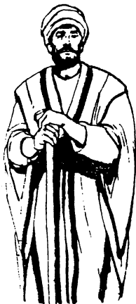
Chivinin ju Eliú

Pus ju acsnich apumatam lapanac tsucuchokopa t'achivini' ju Job. Pus ju yuchi lapanac Eliú ixjuncan. Chai ju yuchi jantu tu'u' ixnajunta ju ixlhi'ap'ulhnan ni va palaica' ask'at'ats'alh ixjunita. Pus palaich lack'ajin ixtajunita ju ali'in ju ixtat'avilanalh. Chai va ix'alacpaxantach ni p'ulhnanch catachivink'o ju yu'unch.